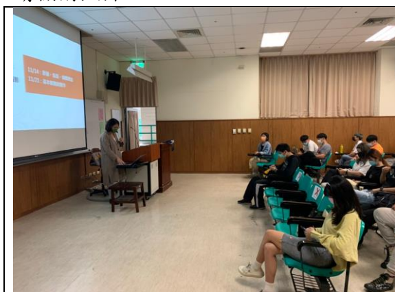
說明：講師上課情形