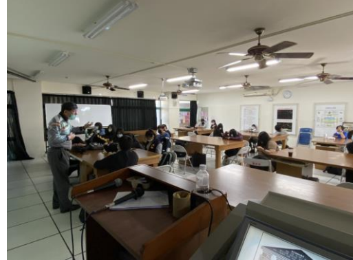
說明:上課與學生互動(二)