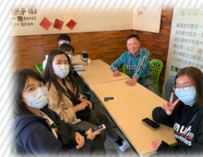
東東芋園業者訪談