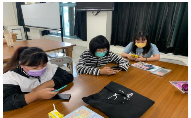
說明：學生利用手機實作情形 1