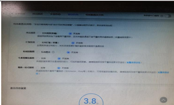
說明：阿里巴巴後台介紹情形