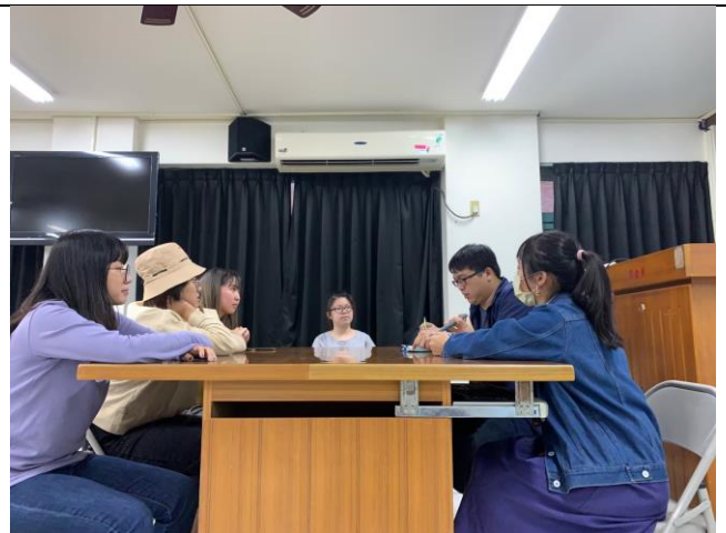
說明：分組課堂討論