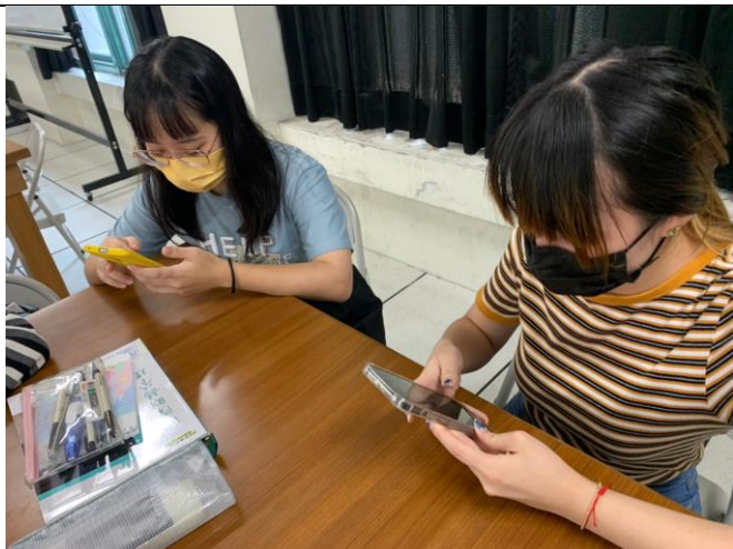
說明：學生利用手機實作情形 2