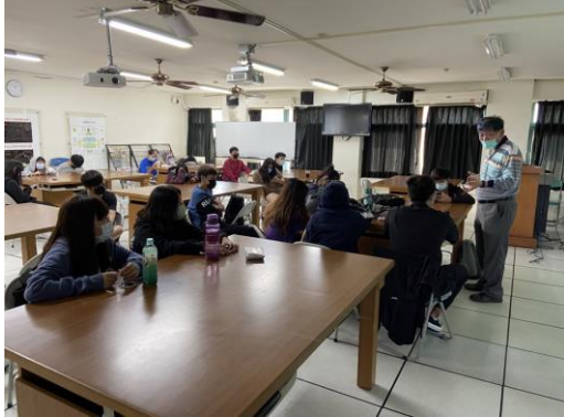
說明:上課與學生互動(一)