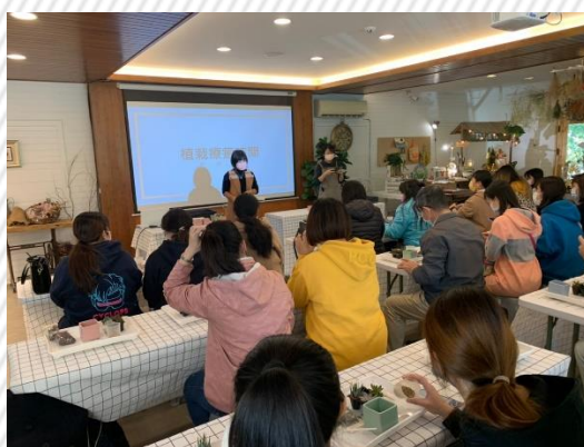
青年創業經驗分享