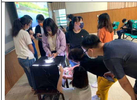
說明：學生課堂實作 2