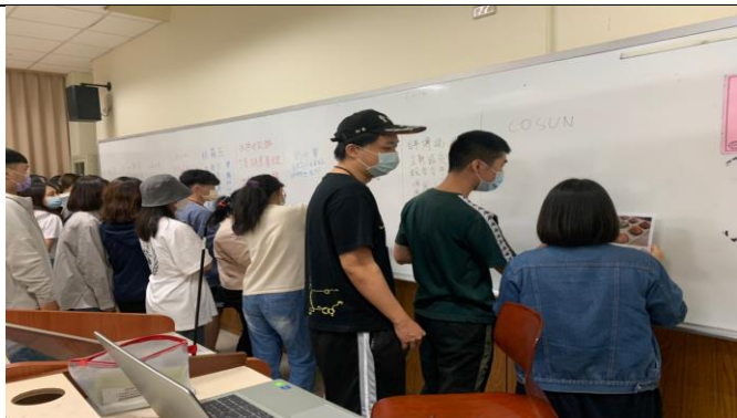
說明：各組分享媒合店家商品文案