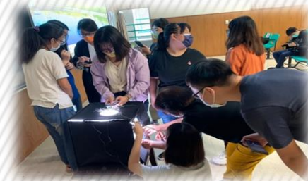
商品拍攝教學實作