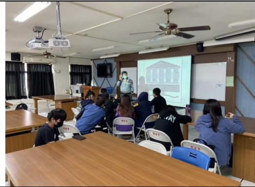
說明: :電子商務經營的範疇