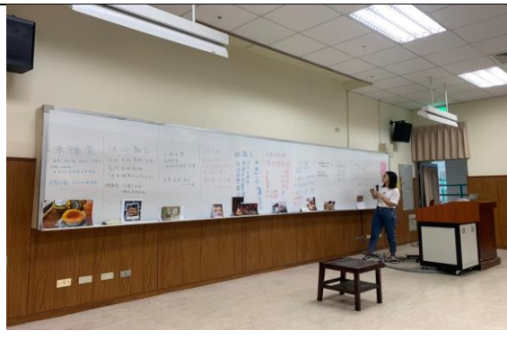
說明：業師進行講評