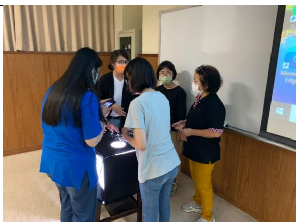
說明：學生課堂實作 1