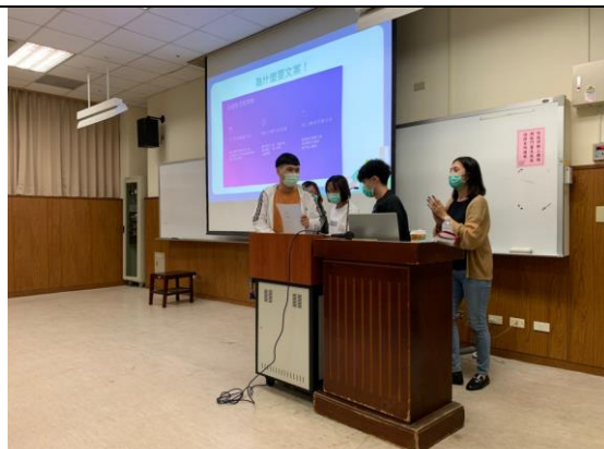
說明：各組上台分享