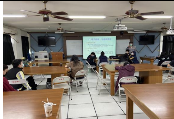
說明:電子商務說明